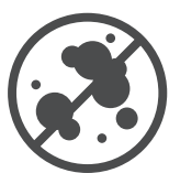
Schimmelbildung wird vermieden

Abfallschlüssel-N°: 080112 (Farb- und Lackabfälle ohne Lösemittel)