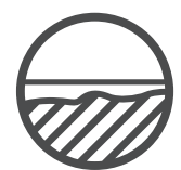
Unebene Oberflächen ausgleichen