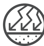
Hohe Haltbarkeit und Belastbarkeit