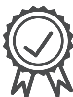
Hohe Qualität und geprüfte Produkte